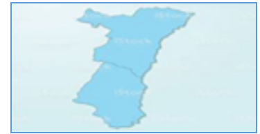
Bassin Universitaire Strasbourg