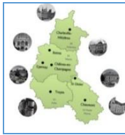
Bassin Universitaire de Reims Champagne - Ardenne